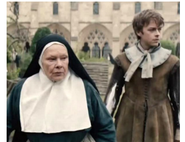
2015 TULIP FEVER (Tulip Fever) de Justin Chadwick avec Dan De Haan