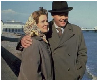
1986 POSTE RESTANTE (84 Charing Cross Road) de David Hugh Jones avec Anthony Hopkins