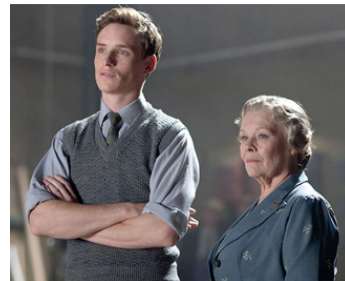
2011 WY WEEK WITH MARILYN (My Week with Marilyn) de Simon Curtis avec Eddie Redmayne