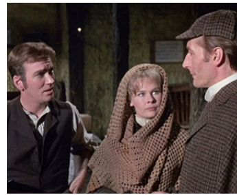
1965 SH. HOLMES CONTRE JACK L'ÉVENTREUR (A Study in Terror) de J. Hill avec J. Fraser, J. Neville