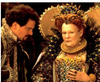
1998 SHAKESPEARE IN LOVE de John Madden avec Colin Firth