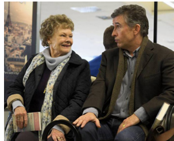
2012 PHILOMENA (Philomena) de Stephen Frears avec Steve Coogan