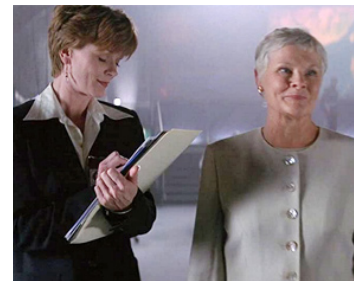
1997 DEMAIN NE MEURT JAMAIS (Tomorrow never dies) de R. Spottiswoode avec S. Bond