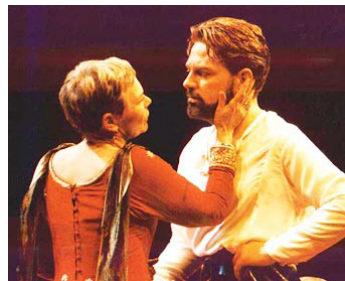
1996 HAMLET (William Shakespeare's Hamlet) de et avec Kenneth Branagh