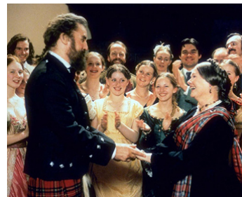
1996 LA DAME DE WINDSOR (Mrs Brown) de John Madden avec Billy Connolly