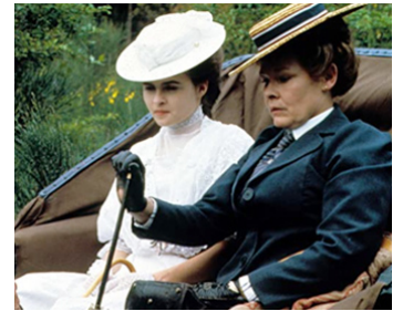
1985 CHAMBRE AVEC VUE (A Room with a View) de James Ivory avec Helena Bonham-Carter