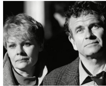
1983 WETHERBY (Wetherby) de David Hare avec Ian Holm