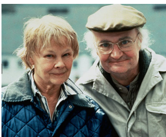
2001 IRIS (Iris) de Richard Eyre avec Jim Broadbent