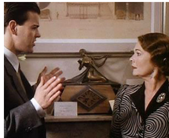
1987 UNE POIGNÉE DE CENDRE (A Handful of Dust) de Charles Sturridge avec Rupert Graves