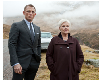
2014 007 SPECTRE (Spectre) de Sam Mendes avec Daniel Craig