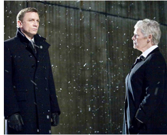
2007 QUANTUM OF SOLACE (Quantum of Solace) de Marc Forster avec Daniel Craig