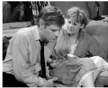
1964 QUATRE HEURES DU MATIN (Four in the Morning) d'A. Simmons avec Norman Rodway