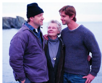
2001 TERRE NEUVE (The Shipping News) de Lasse Hallström avec Kevin Spacey, Jason Behr