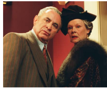
2005 MME HENDERSON PRÉSENTE (Mrs Henderson presents) de Stephen Frears avec Bob Hoskins