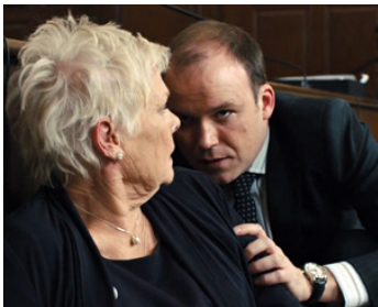
2012 SKYFALL (Skyfall) de Sam Mendes avec Rory Kinnear