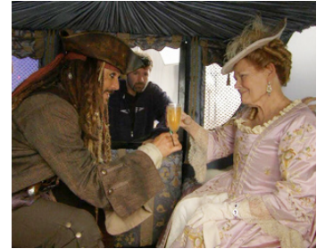
2010 PIRATES DES CARAÏBES 4 (On Stranger Tides) de Rob Marshall avec Johnny Depp