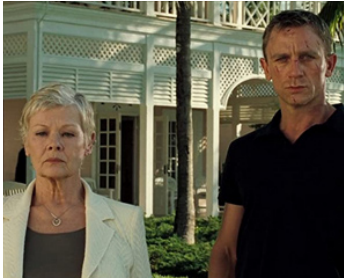
2006 CASINO ROYALE (Casino Royale) de Martin Campbell avec Daniel Craig