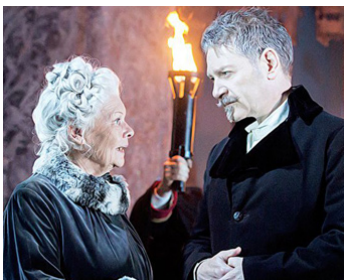
2015 CONTE D'HIVER (The Winter's Tale) de Rob Ashford avec Kenneth Branagh