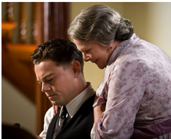
2010 J. EDGAR (J. Edgar) de Clint Eastwood avec Leonardo DiCaprio