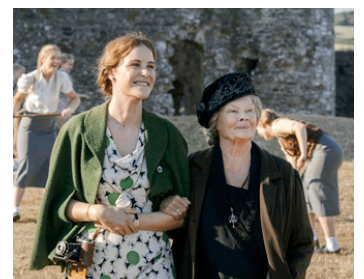
2020 SIX MINUTES TO MIDNIGHT d'Andy Goddard avec Carla Juri