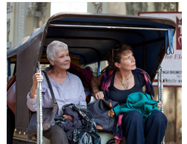
2011 INDIAN PALACE (The best exotic Marigold Hotel) de John Madden avec Celia Imrie