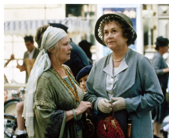
1998 UN THÉ AVEC MUSSOLINI (Tea with Mussolini) de F. Zeffirelli avec Joan Plowright