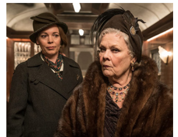
2017 LE CRIME DE L'ORIENT-EXPRESS (Murder... of the Orient-Express) de K. Branagh avec Olivia Colman