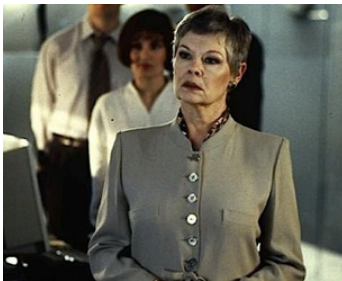
1994 GOLDENEYE (GoldenEye) de Martin Campbell avec Samantha Bond