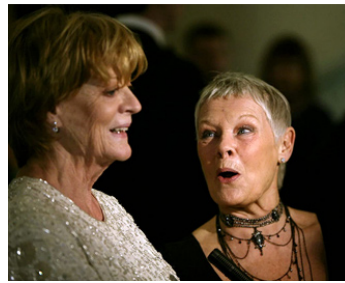
2004 LES DAMES DE CORNOUAILLES (Ladies in Lavender) de Charles Dance avec Maggie Smith