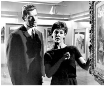
1963 LE SECRET DU DR WHITSET (The Third Secret) de Ch. Crichton avec Stephen Boyd