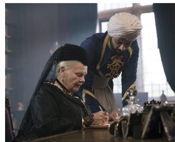
2017 CONFIDENT ROYAL (Victoria & Abdul) de Stephen Frears avec Ali Fazal