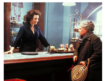
2000 LE CHOCOLAT (Chocolat) de Lasse Hallström avec Juliette Binoche