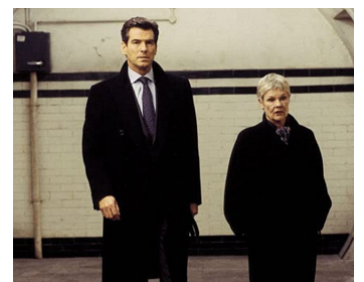
2002 MEURS UN AUTRE JOUR (Die another Day) de Lee Tamahori avec Halle Berry