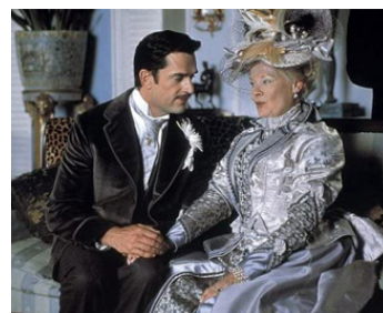
2001 L'IMPORTANCE D'ÊTRE CONSTANT (The importance of being earnest) d'Oliver Parker avec R. Everett