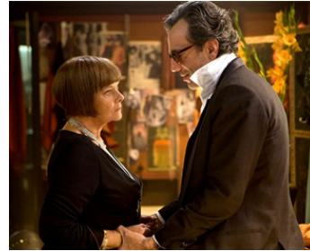
2009 NINE (Nine) de Rob Marshall avec Daniel Day-Lewis