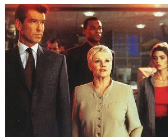
1999 LE MONDE NE SUFFIT PAS (The World is not enough) de M. Apted avec Pierce Brosnan