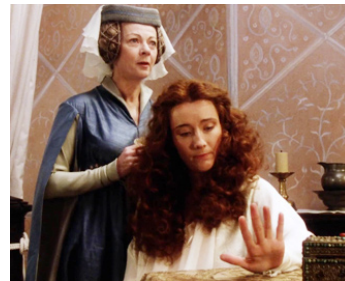
1989 HENRY V (Henry V) de Kenneth Branagh avec Emma Thompson