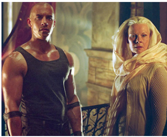
2003 LES CHRONIQUES DE RIDDICK (The Chronicles of Riddick) de David Twohy avec Vin Diesel