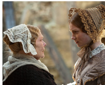
2011 JANE EYRE (Jane Eyre) de Cari Fukunaga avec Mia Wasikowska