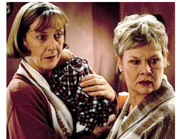
1994 JACK ET SARAH (Jack and Sarah) de Tim Sullivan avec Eileen Atkins