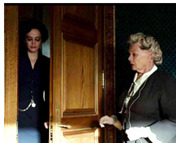
2016 MISS PEREGRINE (Miss Peregrine's home for peculiar Children) de Tim Burton avec Eva Green