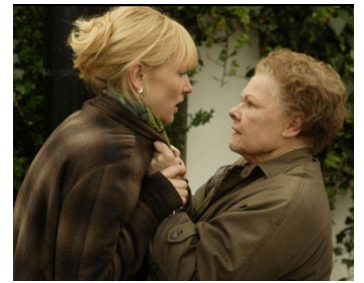
2005 CHRONIQUE D'UN SCANDALE (Notes on a Scandal) de Richard Eyre avec Cate Blanchett