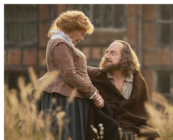
2018 TOUT EST VRAI (All is true) de Kenneth Branagh avec Kenneth Branagh